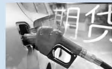
交易中心固基石 期货蓄势待发

场低价的抄底行为，而是基于国家能源安全的长远考虑，加快补充原油储备缺口，以保障国家能源和经济建设安全。但我国石油储备水平低的重要原因之一就是企业普遍存在着一种低进高出的获利思维，加上商业储备会占用大量的资金，在低油价的当下，由于对未来油价走势预期不明朗，企业大量储油的愿望并不强烈，值得反思！