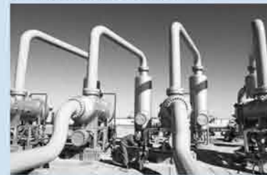
重大突破 下游市场培育可期

中标来评价招标是否成功。要总结其经验和教训，保证中标企业取得顺利进展。政府也应做好完善数据包等准备工作，别让改革成为口号。