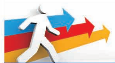
企业文化绝不应停留在口号上

国内很多企业已认识到了企业文化对员工能量、对公司能量的重要性，纷纷创建属于自己的“企业文化”并大肆加以宣扬，但往往形式大于内容。我们可以在很多场合听到企业领导人宣扬的诸如“以人为本”、“人性化管理”的文化理念，但一旦到了基层，听听员工的声音，就会发现完全不是那么回事。例如某民营企业制定了“尊重个人”的企业文化，但实际情况是员工利益经常被漠视，很多事情是老板一个人说了算，员工的诉求得不到回应。这种对内对外“两张皮”的做法不是真正意义上的企业文化，与其有，不如没有。