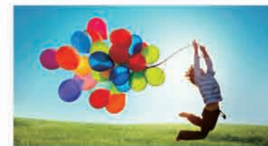
关注员工心理健康

加强企业的软、硬件设施建设，为员工提供轻松的工作环境，有利于员工身心健康和创造力的发挥。如优化办公室环境使之更为舒适，倡导员工之间、上下级之间的无障碍沟通，营造宽松的人文氛围等。在这方面，Google的做法或许值得借鉴。Google总部地处环境优美的加州山景城，办公楼的设计风格别致，员工使用滑板车往来于不同的工作场所；为了满足员工休闲的需要，Google特意建造了别致的休息区；为了满足员工的个性化需要，Google支付预算让员工自己布置办公室，等等。