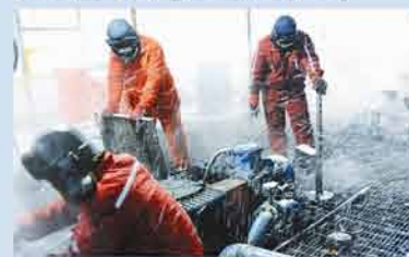
民企“解渴” 油源破冰消融

天然气价格改革不能仅局限于调价幅度或公式的改变，而应着眼于从整个油气产业改革大局，未来应从油气市场结构改革入手，按照放开两头，管住中间的思路，放开气源和销售价格，着重输配气价的监管。