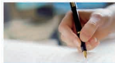
为员工提供轻松的工作环境

鼓励员工参加健身活动，并提供场地、物质等方面的支持；定期组织员工参加体育比赛、户外活动，加强员工体质，增进员工交流，释放员工压力。世界最大的特殊材料制造商——罗门哈斯就特别注重员工的健康管理，实施了一项员工健身计划，每年为每位员工提供1200元的健身费，同时公司还配备了健身设施，并组织员工参与社区篮球、足球比赛，鼓励员工在休息时间多做运动。