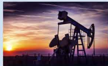
所有制垄断破冰 上游勘探开发改革试点启动

2015年是“十二五”收官之年，低价格、低回报、笼罩着油气行业，日子可谓不易。但改革的脚步却没有停止，政策频出高效提速。在能源总体需求放缓的新常态下，油气行业仍迎难而上，交出颇具亮点的答卷。