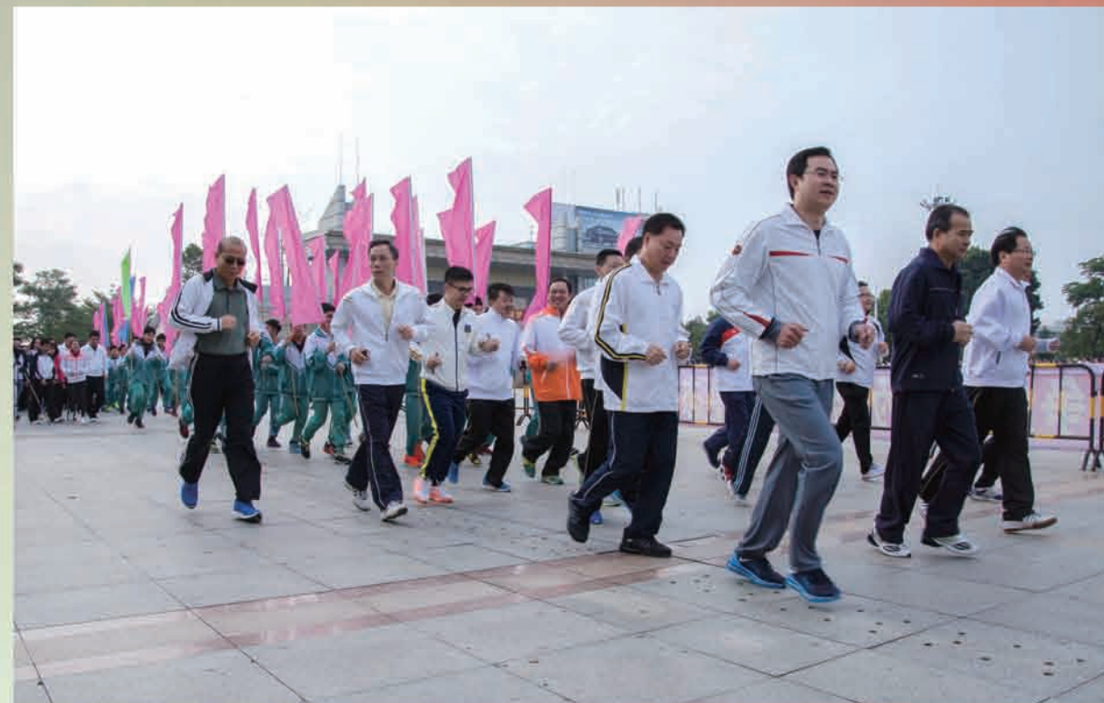
镇领导班子带头领跑 ▲