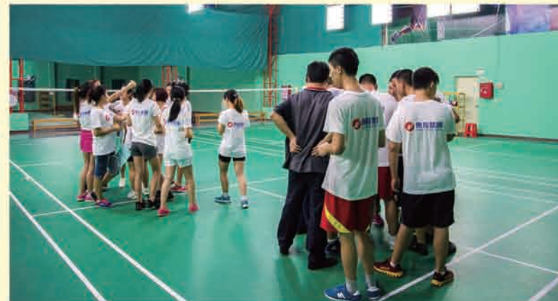
比赛前先进行抽签分组 ▲