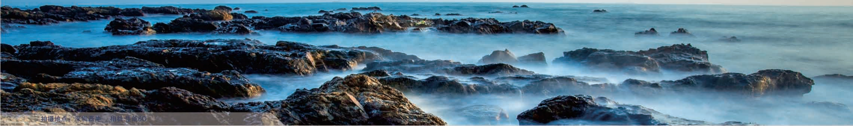
拍摄地点：深圳西涌 相机性能6D