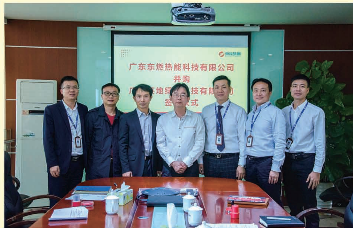
双方代表合影留念 ▼