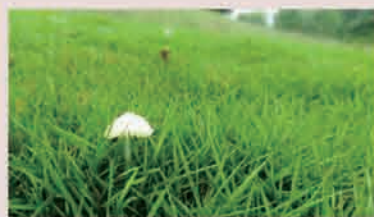
如何拍出主体清晰，背景虚化的效果？

通过上一期对摄影知识的简单介绍，不知道大家对摄影有没有一些了解呢，或许那些乏味的理论知识让很多人不是很感兴趣，觉得我没有单反，日常用手机拍摄的比较多，能不能靠谱点，说些手机的拍摄技巧，那么这期，我就简单的跟大家说下日常生活中，我们用手机拍摄会遇到的一些问题，怎么去解决这些问题，以及怎么去拍好生活中漂亮的事物。