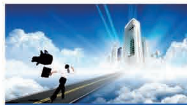
企业文化促进员工能量的发挥

是留不住员工，让员工缺乏安全感和归属感？在笔者看来，这是我们的激励机制出了问题。我们的企业往往过于注重“硬的激励”（即物质激励），而忽略了“软的激励”。这种“软的激励”，便是以企业文化形式呈现的对员工的关怀。