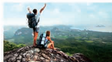
开展多种形式的健身活动

通常而言，员工能量包含身体、情绪、心智、精神等四个方面的内容。首先，“身体是革命的本钱”，健康的体魄是员工创造力发挥的基础条件；情绪控制能力是员工能量的重要组成部分，积极的情绪往往能释放巨大的能量。心智体现的是员工的智力、判断和思考问题的能力，是员工能量的焦点所在；而精神能量则是对成功的向往、追求和自我激励，是最为宝贵的员工能量。因此，对员工的人文关怀可以围绕这四个方面来进行。