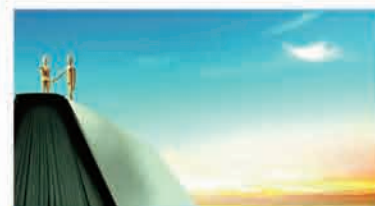
实施人文关怀，调节员工能量

企业文化不是束之高阁的制度文件，不是慷慨激昂的宣传口号，更不是政治思想工作的工具。它是一种深入人心的思想理念，它体现在管理过程的每一个环节，它是能够使员工受益并能感受到点点滴滴。例如摩托罗拉“以人为本”的核心文化理念就落实在公司的各项管理制度和企业行为中，具体内容包括“肯定个人尊严、实施充分的培训、创造无偏见的工作环境、关心每个人的成长和个人前途、为每个员工创造事业成功的条件和体验成功的成就感”等。