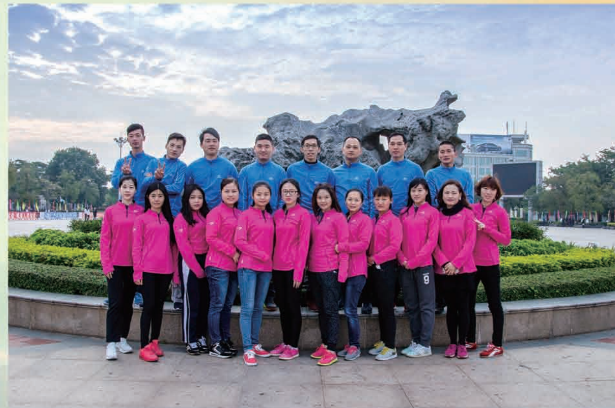
我公司参与迎春长跑的代表们合影留念 ▼