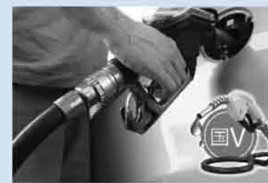
“质”在必行 油品升级重拳出击

革不是一朝一夕就能解决的问题，若上游开采、中间炼化环节存在的垄断问题得不到大幅改变，则成品油价格完全放开的进程仍将崎岖不平。