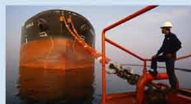
充实“家底” 原油储备提速

破除雾霾之围，政府、相关部门、企业需联手出力，也需要每个消费者低碳生活，责任共担。